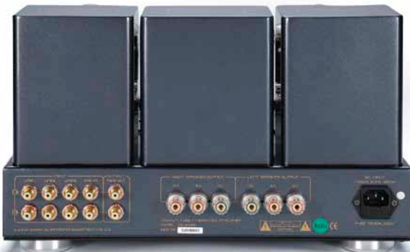
▲ Drei Eingänge zuzüglich eines Endstufen-Zugangs sowie ein Rekorder-Abgriff. Die vergoldeten Lautsprecherklemmen sind röhrentypisch nach Boxen-Widerstand gegliedert.