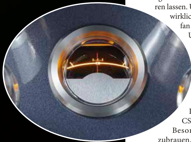
▲ Praktischer Bias-Mess-O-Mat: Steht die Nadel mittig wie im Bild, ist alles in Ordnung. Im Falle einer Abweichung kann man problemlos selber nachjustieren.